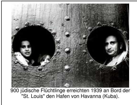
900 jüdische Flüchtlinge erreichten 1939 an Bord der "St. Louis" den Hafen von Havanna (Kuba).

Jahre später reiste Varian Fry im Auftrag der amerikanischen Hilfsorganisation "Emergency Rescue Committee" nach Marseille. In der Stadt hielten sich viele Flüchtlinge auf, denen die Auslieferung durch das französische Vichy-Regime an die deutschen Behörden drohte. Frys Auftrag war es deshalb, möglichst vielen von den Nazis bedrohten Menschen - Juden, Politiker, Schriftsteller, Künstler - bei der Ausreise zu helfen.