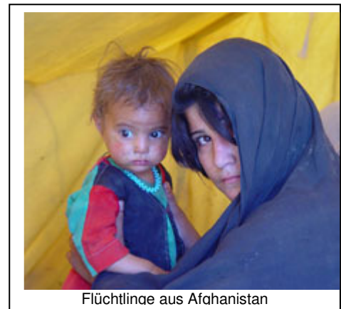
Flüchtlinge aus Afghanistan

Während des Völkermordes in Ruanda sowie der Konflikte in Burundi und der Demokratischen Republik Kongo wurde eine große Zahl von Kindern von ihren Eltern getrennt. Von den Kindern wurden Fotos gemacht und in den verschiedenen Flüchtlingslagern der Nachbarländer gezeigt. Viele Eltern konnten ihre verschollenen Sprösslinge darauf wieder erkennen; auf diese Weise gelang es, die Familien zusammenzuführen.