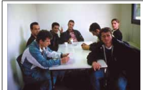
In den 90-er Jahren kamen zahlreiche Asylbewerber aus dem Kosovo, wie diese Männer in Mecklenburg-Vorpommern.

Allerdings werden Asylsuchende nicht aufgenommen, wenn sie aus einem sogenannten sicheren Drittstaat eingereist sind. Hierbei handelt es sich um die Mitgliedstaaten der Europäischen Union sowie Norwegen und die Schweiz. Für die EU-Staaten gilt zudem seit Februar 2003 die sogenannte Dublin-II-Verordnung. Diese regelt, welcher Staat innerhalb der EU für die Durchführung des Asylverfahrens zuständig ist. In der Regel ist dies der EU-Staat, in dem der Asylsuchende zuerst eingereist ist.