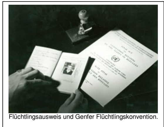
Flüchtlingsausweis und Genfer Flüchtlingskonvention.

Der Ausdruck Asyl stammt vom griechischen Wort "asylon" und bedeutet unverletztbar. Es gibt ihn seit mindestens 3500 Jahren. Um 1500 vor Christus gab es im Nahen und Mittleren Osten Staaten mit deutlichen Grenzen zu den Nachbarländern. Zwischen den Herrschenden wurden mehrere Verträge zum Schutz von Flüchtlingen geschlossen. So erhielt beispielsweise der von seinem Onkel abgesetzte Hethiterkönig Urhi-Teshup um 1300 vor Christus vom Pharao Ramses II. Asyl in Ägypten.