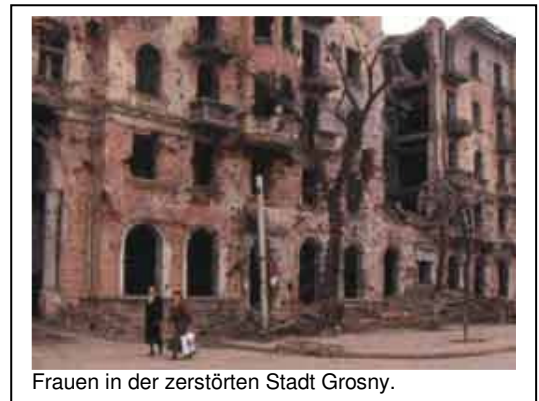
Frauen in der zerstörten Stadt Grozny.

Früher war die mittlerweile 50-jährige Tschetschenin solche Umstände tatsächlich nicht gewohnt, im Gegenteil: In ihrer Heimat war sie Kinderärztin und arbeitete zudem bei einer humanitären Organisation. Durch die Gewalt in Tschetschenien und die Flucht hat sich ihr Leben grundlegend verändert - im Asylland Österreich arbeitet sie jetzt als Putzfrau.