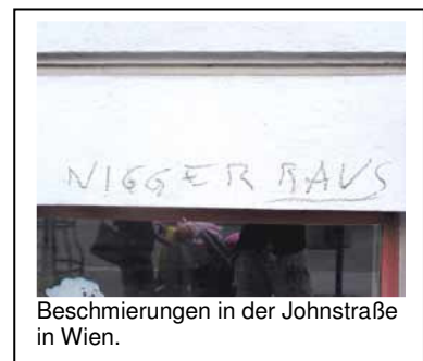
Beschmierungen in der Johnstraße in Wien.