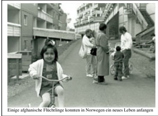
Einige afghanische Flüchtlinge konnten in Norwegen ein neues Leben anfangen

In der Präambel der Allgemeinen Menschenrechte der UNO steht ferner, Menschenrechte durch die Herrschaft der Mensch nicht gezwungen wird, als letztes Mittel zum Aufstand gegen Tyrannei und Unterdrückung zu greifen ".