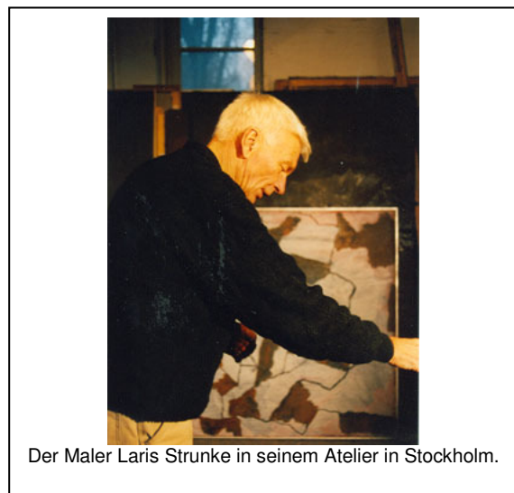
Der Maler Laris Strunke in seinem Atelier in Stockholm.

Ein bekannter schwedischer Künstler, Laris Strunke, kam im Alter von dreizehn Jahren als Flüchtling aus Lettland nach Schweden. Er floh 1944 mit seinen Eltern und Geschwistern in einem Boot über