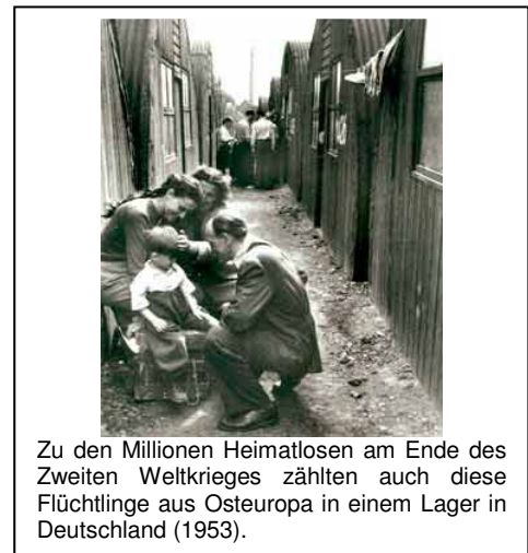
Zu den Millionen Heimatlosen am Ende des Zweiten Weltkrieges zählten auch diese Flüchtlinge aus Osteuropa in einem Lager in Deutschland (1953).

Als "Displaced Persons" bezeichnete man Millionen von Menschen in Europa, die sich nach dem Ende des Zweiten Weltkrieges 1945 außerhalb ihres Heimatlandes befanden - zumeist ehemalige Zwangsarbeiter oder Häftlinge aus Konzentrationslagern. Die Nationalsozialisten hatten während des Krieges allein 11,3 Millionen Menschen - überwiegend Osteuropäer - zur Zwangsarbeit nach Deutschland verschleppt.