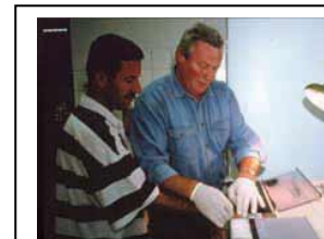
Abnahme der Fingerabdrücke eines Asylbewerbers beim Bundesamt für die Anerkennung ausländischer Flüchtlinge in Nürnberg (heute Bundesamt für Migration und Flüchtlinge).

Während das Zuwanderungsgesetz noch verhandelt wurde, sank die Zahl der Asylbewerber in Deutschland auf immer neue Tiefststände. 2005 war sie so niedrig wie in den 22 Jahren zuvor nicht mehr. Das lag an vielfältigen Gründen. Einerseits hat sich die Situation in vielen Herkunftsländern verändert. Andererseits aber haben es gesetzliche Regelungen für Flüchtlinge immer schwerer gemacht, in Deutschland Asyl zu beantragen.