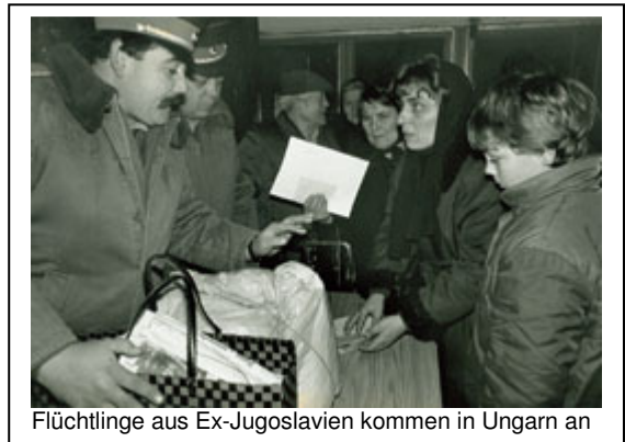
Flüchtlinge aus Ex-Jugoslavien kommen in Ungarn an

Die Regierungen schaffen Verfahren zur Feststellung der Flüchtlingseigenschaft, um den rechtlichen Status und die Rechte einer Person innerhalb ihrer innerstaatlichen Rechtsordnung festzulegen. UNHCR kann dabei Beratung anbieten, um gemäß seinem Mandat das Flüchtlingsrecht zu fördern, Flüchtlinge zu schützen und die Umsetzung der Genfer Flüchtlingskonvention von 1951 zu