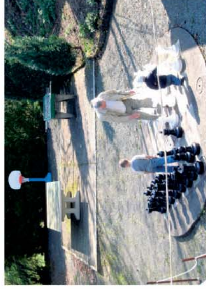
...sich sportlich betätigen, oder...