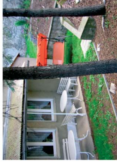
.... auf der hauseigenen Terrasse den Tag Revue passieren lassen oder grillen.

Kapazitäten gibt es für bis zu 28 Personen. Die Unterbringung erfolgt in 2 Einzel-, 7 Doppel- sowie in 3 Mehrbettzimmern (zentrale Sanitäranlagen). Eine Aufbettung ist auf Anfrage möglich. Darüber hinaus steht ein Bungalow zur Verfügung.