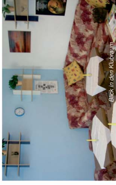
Blick in den Klubraum.

Kapazitäten gibt es für bis zu 28 Personen. Die Unterbringung erfolgt in 2 Einzel-, 7 Doppel- sowie in 3 Mehrbettzimmern (zentrale Sanitäranlagen). Eine Aufbettung ist auf Anfrage möglich. Darüber hinaus steht ein Bungalow zur Verfügung.