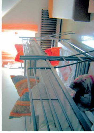
Nach einem ereignisreichen Tag kann man sich einfach in die liebevoll eingerichteten Zimmer zum Erholen zurückziehen oder...

Für das leibliche Wohl ist selbstverständlich auch gesorgt. Eine Verpflegung ist in Vollpension und Halbpension möglich. Eine Selbstversorgung ist bedingt und nur nach Absprache möglich.