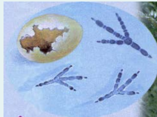
Kräh e ▲